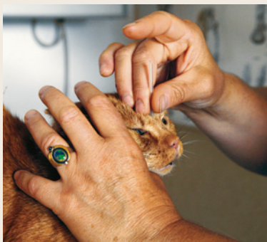
Acupuncture et Médecine Traditionnelle Chinoise